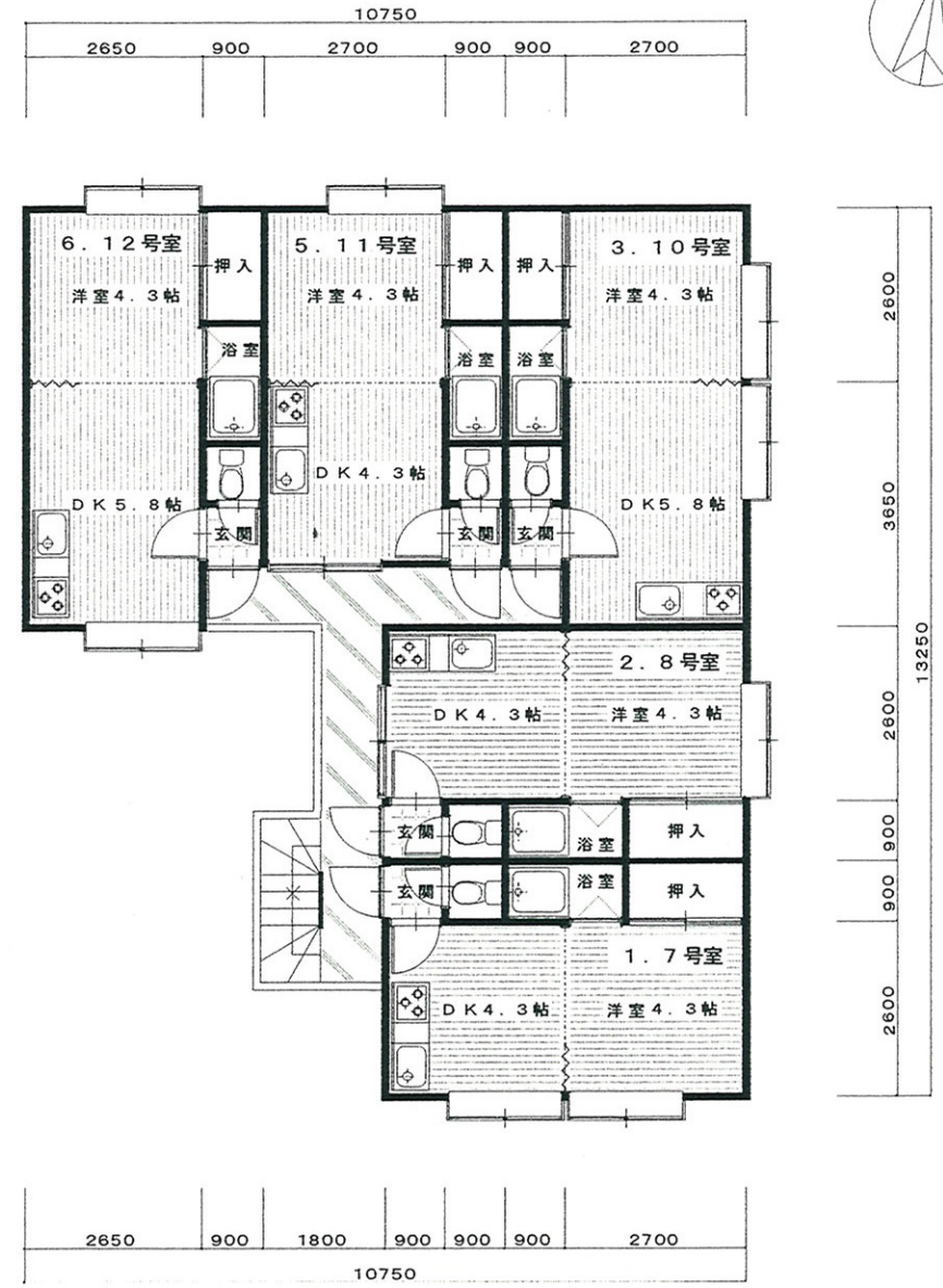
CH創成 A棟 1.2階平面図